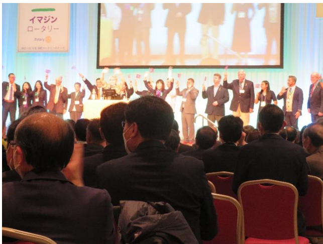
パシフィックベイスングループ(PBG)の方々