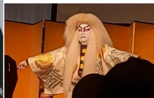
「石橋 (しゃっきょう)」