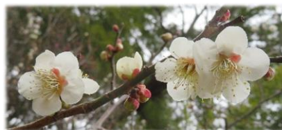
谷保天満宮の白梅