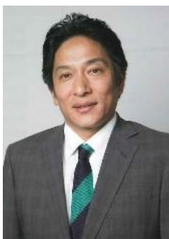
記念講演 原 晋氏 青山学院大学陸上競技部 長距離ブロック監督 「つながり」