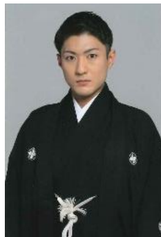
特別公演 中村橋之助氏 歌舞伎役者