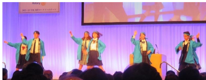
青少年交換学生による踊り「ソーラン節」