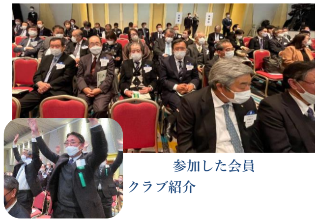
参加した会員 クラブ紹介