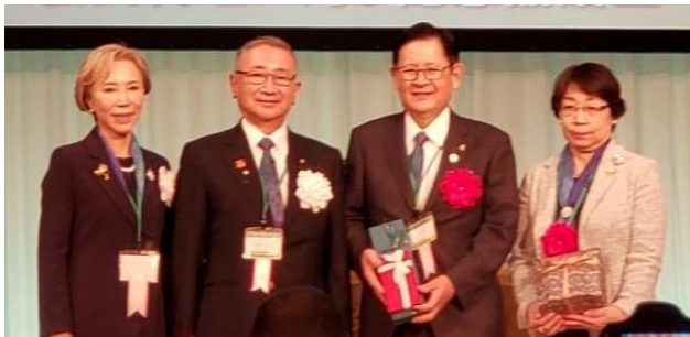
富澤ガバナーご夫妻(左)RI 会長代理ご夫妻