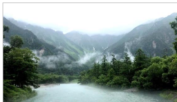
河童橋からの穂高連峰