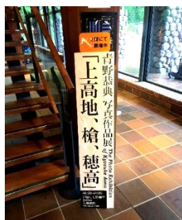
インフォメーションセンター