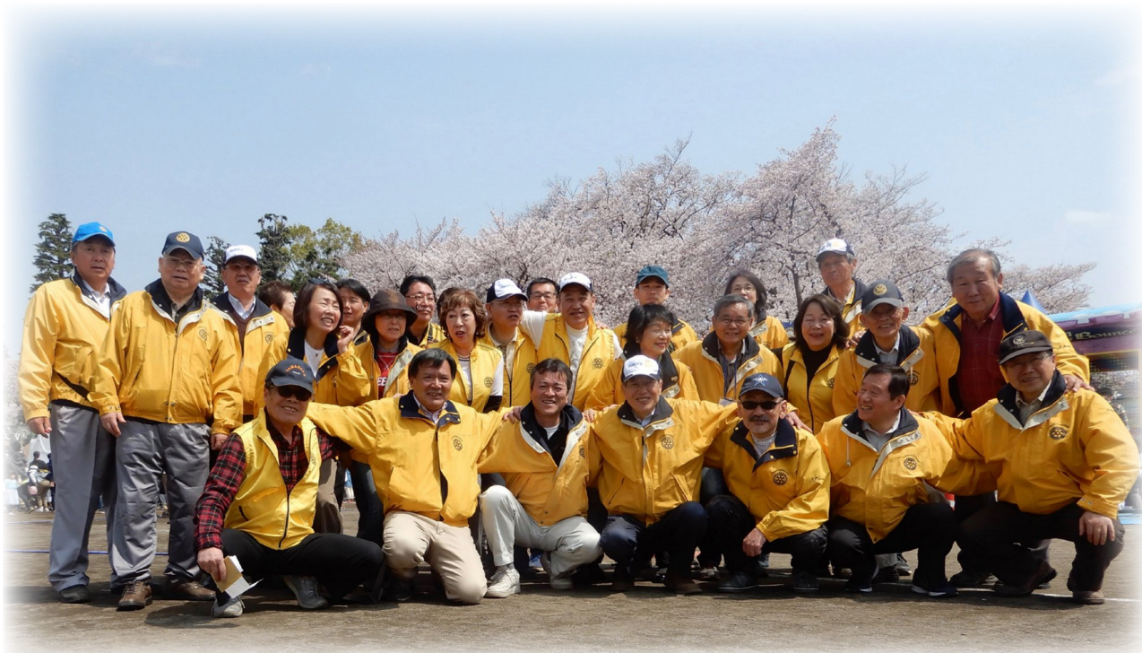
▲ 満開の桜と青い空。最高のコンディションに恵まれたさくらフェスティバル