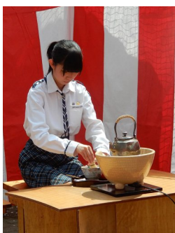
◀ガールスカウトは今年も野点。