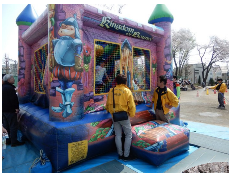
▲ジャンボバルーンには一日中長い親子連れの列ができていた。そのお世話をする会員の活動に頭が下がる。