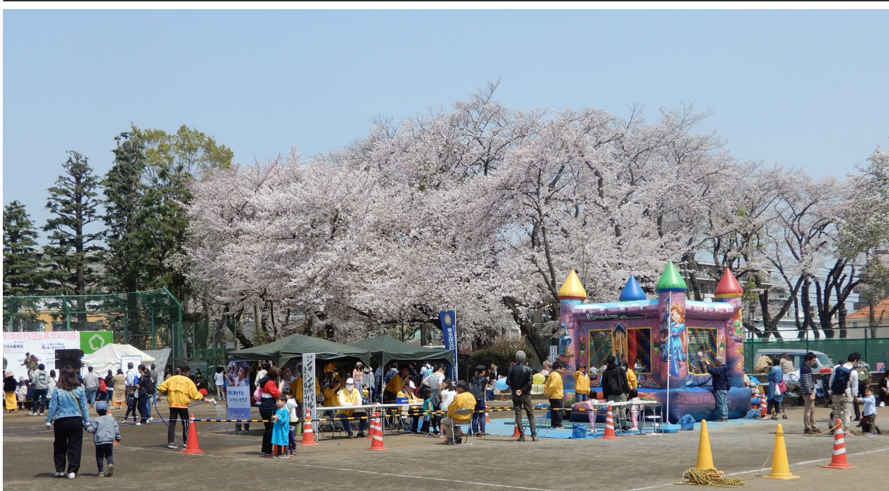
▲青空のもと、桜が満開。さくらフェスティバルの会場では様々なイベントが行われていた。