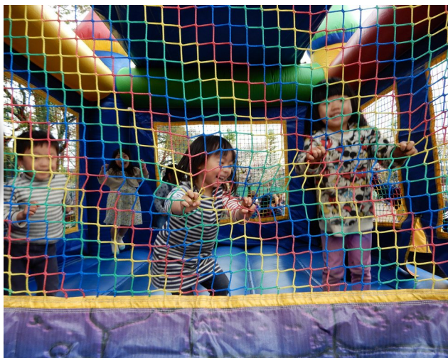
▲ジャンボバルーンの中からは子供たちの歓声が絶えない。