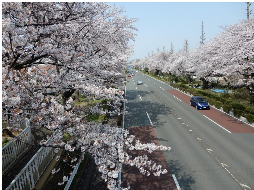
▲国立いちばんのサクラの撮影スポットから『春爛漫』をパチリ！（4月7日）