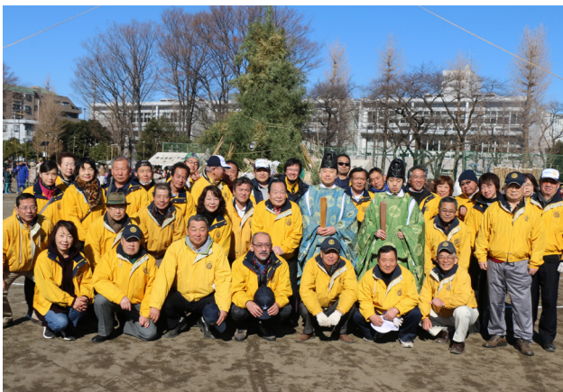
▲移動例会の後、かまくらの前で記念撮影