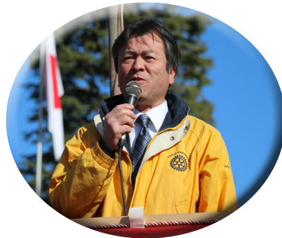
▲実行委員長として挨拶をする本間会員