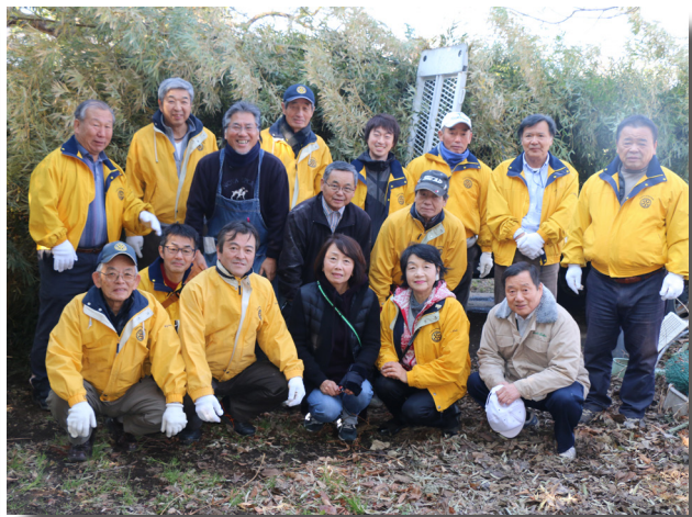
▲孟宗竹取り作業後の記念写真