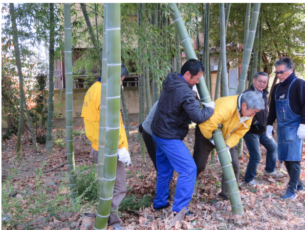
▲孟宗竹取りの作業に奮闘

2基のかまくらは、やがて大きな火柱になって天に舞い上がった。ポンポンという竹が弾ける威勢のいい音を聴きながら、今年も家内安全と無病息災を祈った。