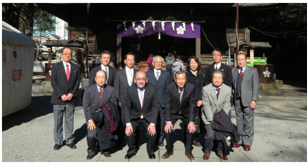
▲初詣後の理事・役員

います。そして私は脊柱管狭窄症の手術のために11月から休会いたしました。それでも週報は1回を除いてすべて発行できました。ご迷惑をおかけいたしました。