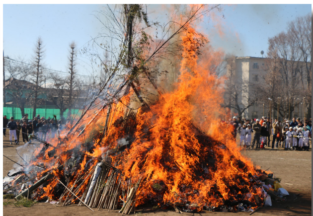
▲ポンポンと大きな音を立てて燃え盛るかまくら