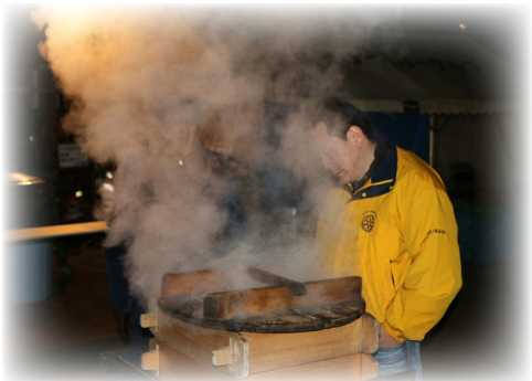
▲夜明け前から団子を蒸す作業に精を出す千葉会員