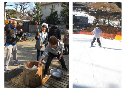
▲餅つきに挑戦しました