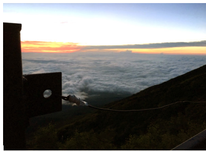
▲富士山からの見る日の出に感激しました