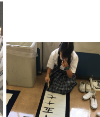
▲習字のお稽古をしました