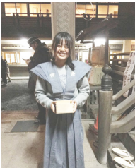
▲節分祭で袴を着て豆まきをしました