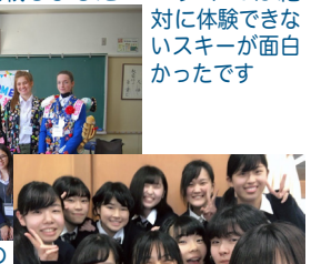
▲友だちが誕生日を祝ってくれました