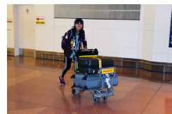
▲日本に到着しました。

11月から一緒に暮して、日本語も話せるようになり、5年生の娘と同じくらい漢字を書けるようになっています。冬の間はよく寒い・寒いと言っていました。きょうから川向会員宅へ移ります。帰国まであと4か月です。