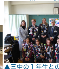
▲三中の1年生との交歓会は楽しかったです