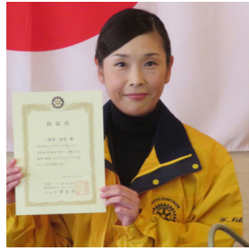
長嶋親睦活動委員長