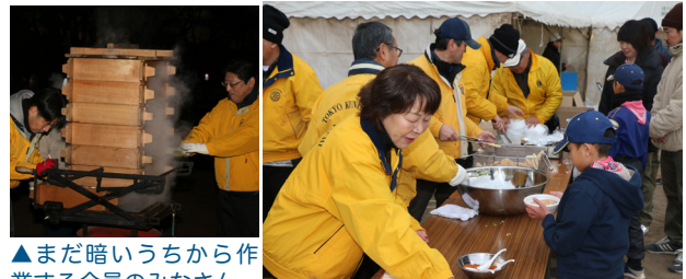
▲まだ暗いうちから作業する会員のみなさん。

第41回塞の神どんど焼きは、1月8日(成人の日)に国立市谷保第三公園で開催された。例年通り11時から移動例会(24日、第2350回の振替)が行われた。わがクラブは社会奉仕委員会を中心に、前日の孟宗竹取りの作業に引き続き、当日は午前6時から、団子を蒸す作業や朝食の提供など、懸命に奉仕の汗を流した。