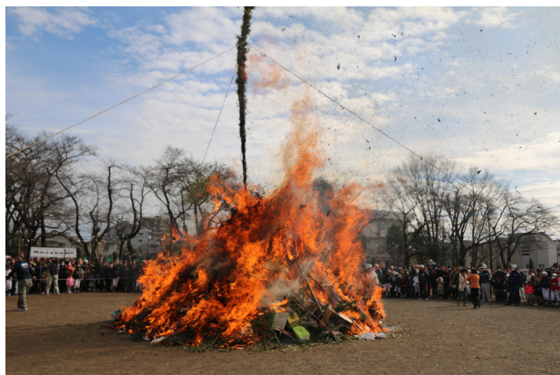
▲当日(8日)の午後からは雨の予報だったが、点火ごろから青空が広がり、薄日がさしてきた。参加者たちは、燃え盛る炎に今年1年の家内安全と無病息災を願った。

第41回塞の神どんど焼きは、1月8日(成人の日)に国立市谷保第三公園で開催された。例年通り11時から移動例会(24日、第2350回の振替)が行われた。わがクラブは社会奉仕委員会を中心に、前日の孟宗竹取りの作業に引き続き、当日は午前6時から、団子を蒸す作業や朝食の提供など、懸命に奉仕の汗を流した。