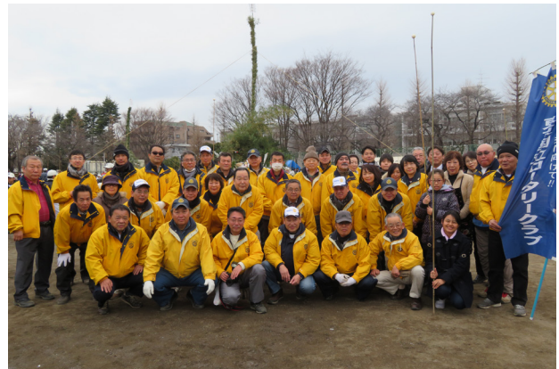
▲移動例会後の記念撮影。今回のどんど焼きは例年よりも人出が少ない。1500人ぐらいだという。それでもわがクラブは、ひととき目立つ黄色いジャンパーで、クラブの存在をアピールした。