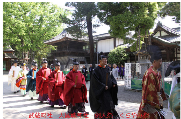
武蔵総社 大國魂神社 例大祭 くらやみ祭

私の出身は東京武蔵府中 RC (多摩東 グループ) です。1988年6月に創立し、来年度が創立30周年です。会員数は47名(女性会員2名)です。主な奉仕活動は『家