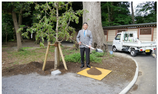
▲ガバナー就任を記念して桜の木を奉納植樹しました。