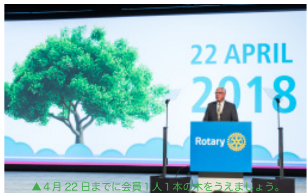
▲4月22日までに会員1人1本の木を植えましょう。

また、地球環境のために 明年4月22日のアースデーまでに、会員1人1本の木を植えましょうとおっ