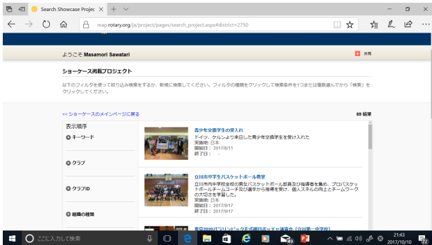
▲ My Rotary には情報が満載です。

RI の方針や、地区の活動状況、何よりも自クラブの活動状況が把握できるのでとても便利です。