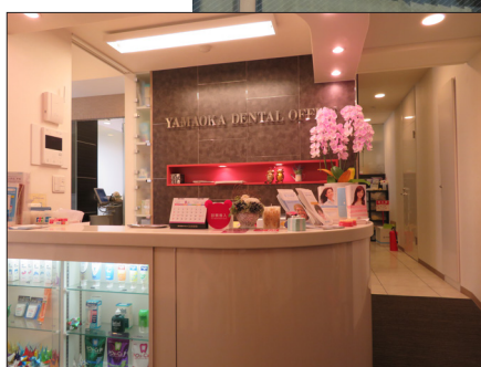
▲ 山岡デンタルオフィス