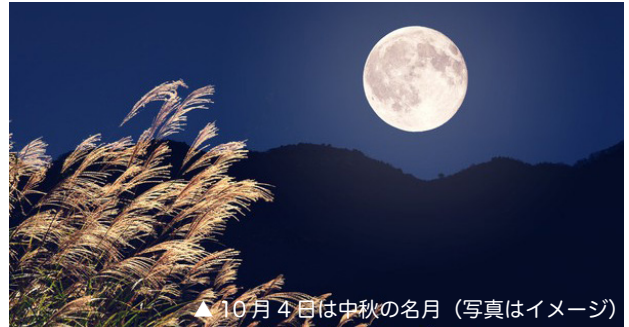
▲10月4日は中秋の名月（写真はイメージ）

9月に入りましてからは、テレビを付けますと毎日のように北のミサイルの報道をどこの番組も扱っていましたが、先日9月28日に国会が解散され、今度は選挙