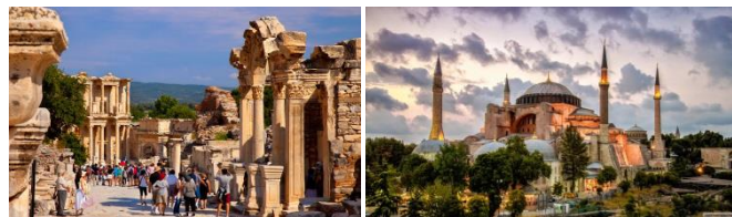
(左)劇場 İzmir efes antik kenti tiyatrosu