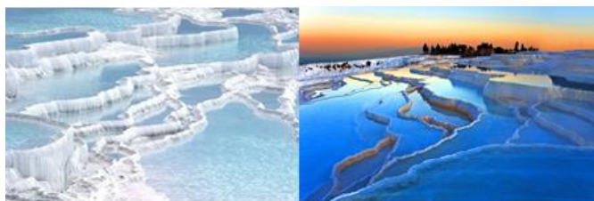
パムッカレ 世界遺産 石灰華段丘からなる丘陵地