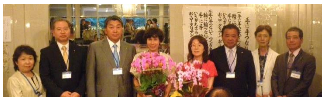
新旧会長幹事 バッチ交換・花束贈呈

会長を補佐してあっという間の1年間だった様な気がしています。色々な経験・勉強をしました。理事・会員・ご家族の皆さんに支えられて、1年を過ごす事ができましたことに御礼を申し上げます。