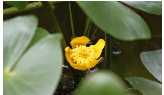
▲ヒメスイレン