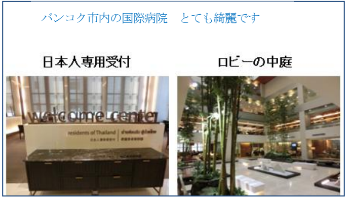
バンコク市内の国際病院 とても綺麗です