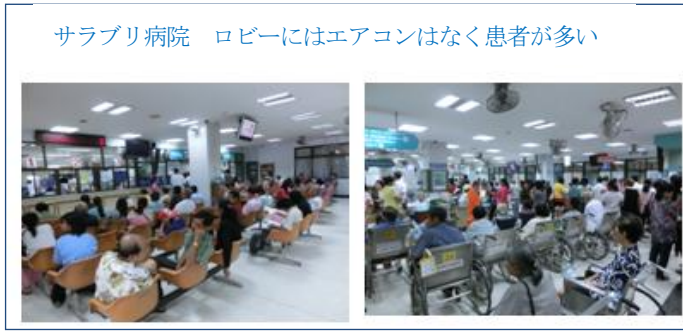
サラブリ病院 ロビーにはエアコンはなく患者が多い