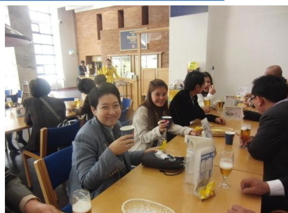
▲サントリービール武蔵野工場 見学