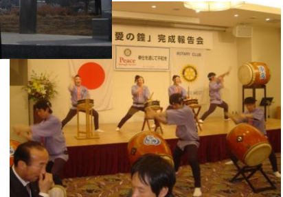
▲地元の高校生が和太鼓で歓迎

当クラブは早い時点からこの計画に賛同し、支援を申し出ていました。モニュメントの横に建つ記念碑の裏には、協力した地区やクラブ名が刻まれています。東京国立RCの文字を見つけると、胸に暑いものが込み上げてきます。