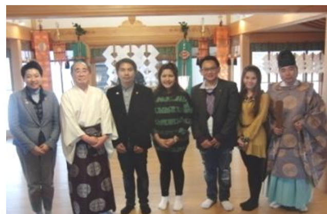
▲谷保天満宮 参拝 (例会前)