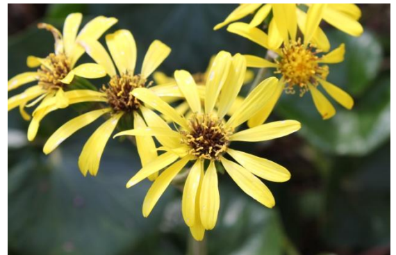
▲ツワブキ

隔月に行っています卓上募金にご協力をお願いいたします。(本日の募金額 22,387円)